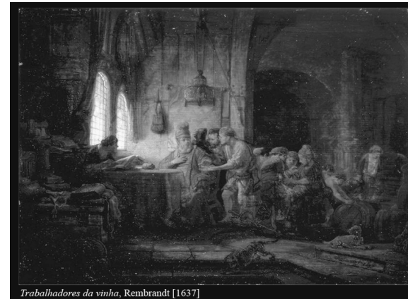
Trabalhadores da vinha, Rembrandt [1637]

A liturgia do 25º Domingo do Tempo Comum convida-nos a descobrir um Deus cujos caminhos e cujos pensamentos estão acima dos caminhos e dos pensamentos dos homens, quanto o céu está acima da terra. Sugere-nos, em consequência, a renúncia aos esquemas do mundo e a conversão aos esquemas de Deus.