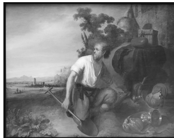
Parábola do tesouro escondido, Rembrandt 1630

A liturgia deste domingo convida-nos a refletir nas nossas prioridades, nos valores sobre os quais fundamentamos a nossa existência. Sugere, especialmente, que o cristão deve construir a sua vida sobre os valores propostos por Jesus.