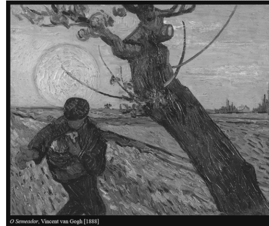
O Semeador, Vincent van Gogh [1888]

A liturgia do 15º Domingo do Tempo Comum convida-nos a tomar consciência da importância da Palavra de Deus e da centralidade que ela deve assumir na vida dos crentes.