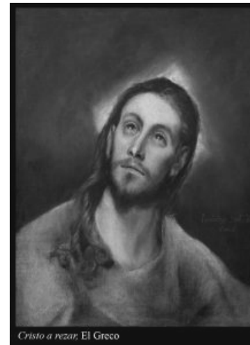
Cristo a pescar, El Greco

A liturgia deste domingo ensina-nos onde encontrar Deus. Garante-nos que Deus não Se revela na arrogância, no orgulho, na prepotência, mas sim na simplicidade, na humildade, na pobreza, na pequenez.