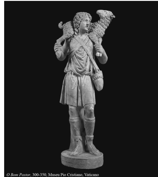
O Bom Pastor, 300-350, Museu Pio Cristiano, Vaticano

O 4º Domingo da Páscoa é considerado o “Domingo do Bom Pastor”, pois todos os anos a liturgia propõe, neste domingo, um trecho do capítulo 10 do Evangelho segundo João, no qual Jesus é apresentado como “Bom Pastor”. É, portanto, este o tema central que a Palavra de Deus põe hoje à nossa reflexão.