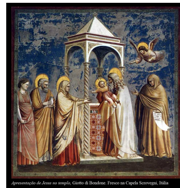
Apresentação de Jesus no templo, Giotto di Bondone. Fresco na Capela Scrovegni, Itália

“Peçamos sempre a Deus a humildade para ser capazes de receber em seguida todas as outras virtudes. A humildade é a base de todo o edifício: quanto maior for, mais fácil será construir .» Padre Dehon