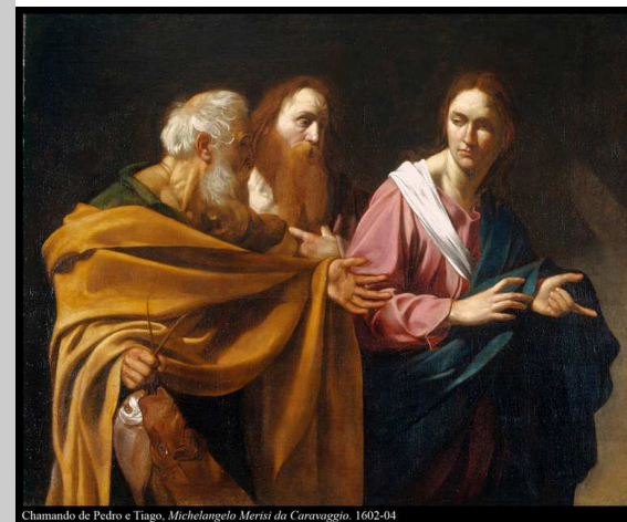
Chamando de Pedro e Tiago, Michelangelo Merisi da Caravaggio, 1602-04

A liturgia deste domingo apresenta-nos o projeto de salvação e de vida plena que Deus tem para oferecer ao mundo e aos homens: o projeto do "Reino".