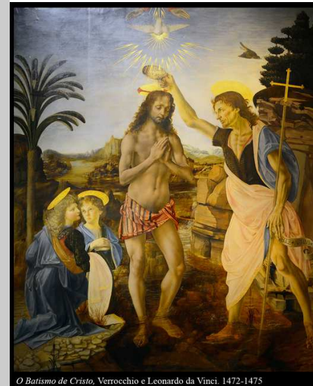
O Batismo de Cristo, Verrocchio e Leonardo da Vinci. 1472-1475

A liturgia deste domingo coloca a questão da vocação; e convida-nos a situá-la no contexto do projeto de Deus para os homens e para o mundo. Deus tem um projeto de vida plena para oferecer aos homens; e elege pessoas para serem testemunhas desse projeto na história e no tempo.