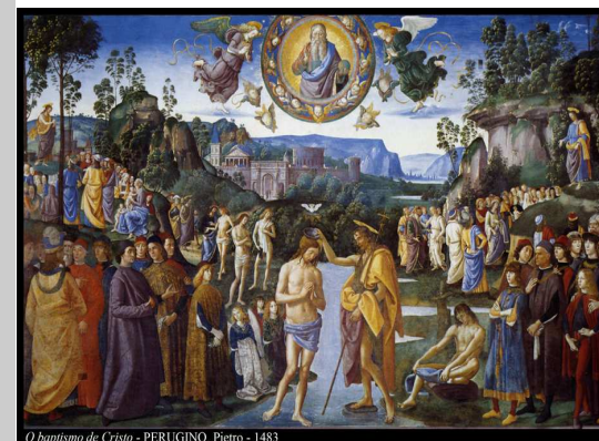
O batismo de Cristo - PERUGINO, Pietro - 1483

A liturgia deste domingo tem como cenário de fundo o projeto salvador de Deus. No batismo de Jesus nas margens do Jordão, revela-se o Filho amado de Deus, que veio ao mundo enviado pelo Pai, com a missão de salvar e libertar os homens. Cumprindo o projeto do Pai, Ele fez-Se um de nós, partilhou a nossa fragilidade e humanidade, libertou-nos do egoísmo e do pecado e empenhou-Se em promover-nos, para que pudéssemos chegar à vida em plenitude.