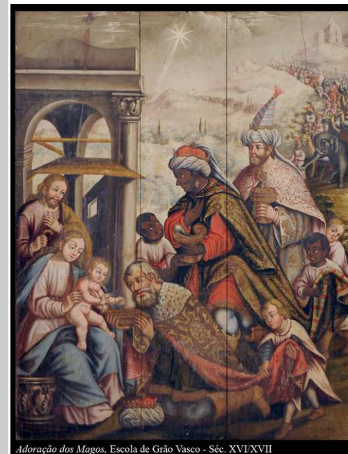
Adoração dos Magos, Escola de Grão Vasco - Séc. XVI/XVII

A liturgia deste domingo celebra a manifestação de Jesus a todos os homens... Ele é uma "luz" que se acende na noite do mundo e atrai a si todos os povos da terra. Cumprindo o projeto libertador que o Pai nos queria oferecer, essa "luz" incarnou na nossa história, iluminou os caminhos dos homens, conduziu-os ao encontro da salvação, da vida definitiva.