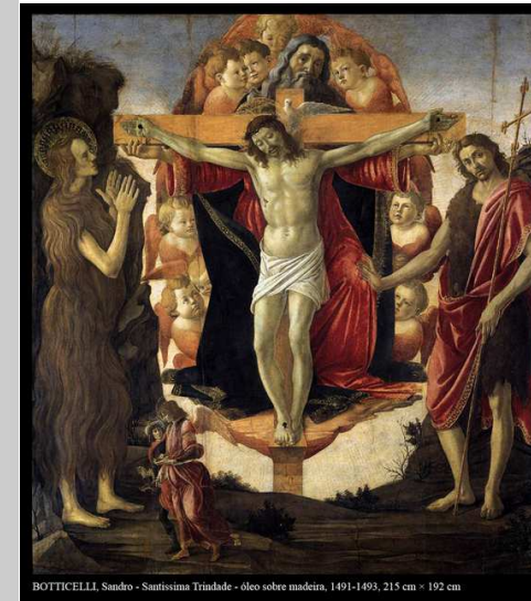
BOTTICELLI, Sandro - Santissima Trindade - óleo sobre madeira, 1491-1493, 215 cm x 192 cm

A Solenidade que hoje celebramos não é um convite a decifrar a mistério que se esconde por detrás de “um Deus em três pessoas”; mas é um convite a contemplar o Deus que é amor, que é família, que é comunidade e que criou os homens para os fazer comungar nesse mistério de amor.