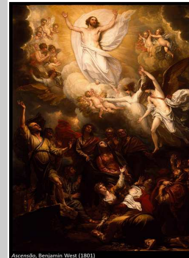
Ascensão, Benjamin West (1801)

A Solenidade da Ascensão de Jesus que hoje celebramos sugere que, no final de um caminho percorrido no amor e na doação, está a vida definitiva, em comunhão com Deus. Sugere, também, que Jesus nos deixou o testemunho e que somos agora nós, seus seguidores, que devemos continuar a realizar o projeto libertador de Deus para os homens e para o mundo.