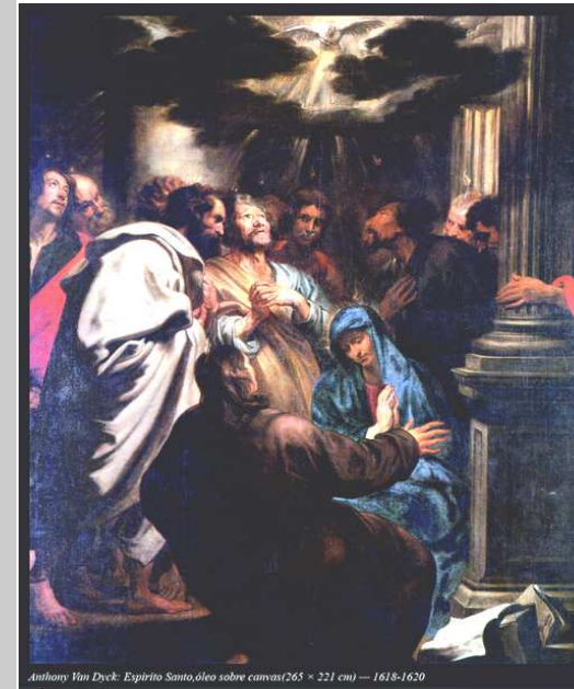
Anthony Van Dyck: Espírito Santo, óleo sobre canvas (265 x 221 cm) — 1618-1620

Na liturgia deste domingo sobressai a promessa de Jesus de acompanhar de forma permanente a caminhada da sua comunidade em marcha pela história: não estamos sozinhos; Jesus ressuscitado vai sempre ao nosso lado.