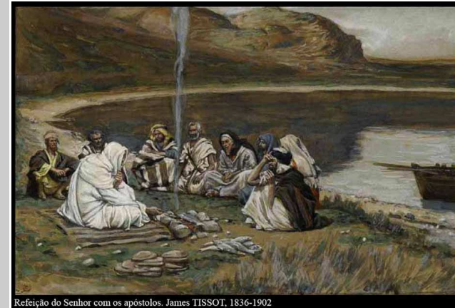
Refeição do Senhor com os apóstolos. James TISSOT, 1836-1902

A liturgia deste 3º Domingo do Tempo Pascal recorda-nos que a comunidade cristã tem por missão testemunhar e concretizar o projeto libertador que Jesus iniciou; e que Jesus, vivo e ressuscitado, acompanhará sempre a sua Igreja em missão, vivificando-a com a sua presença e orientando-a com a sua Palavra.