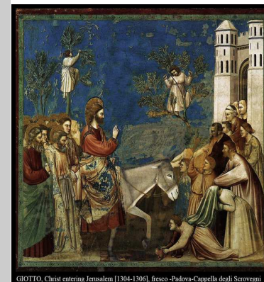
GIOTTO. Christ entering Jerusalem (1304-1306), fresco -Padova-Cappella degli Scrovegni

A liturgia deste último Domingo da Quaresma convida-nos a contemplar esse Deus que, por amor, desceu ao nosso encontro, partilhou a nossa humanidade, fez-Se servo dos homens, deixou-Se matar para que o egoísmo e o pecado fossem vencidos. A cruz (que a liturgia deste domingo coloca no horizonte próximo de Jesus) apresenta-nos a lição suprema, o último passo desse caminho de vida nova que, em Jesus, Deus nos propõe: a doação da vida por amor.