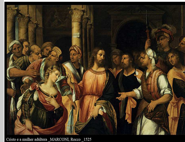
Cristo e a mulher adúltera_MARCONI, Rocco_1525

A liturgia de hoje fala-nos (outra vez) de um Deus que ama e cujo amor nos desafia a ultrapassar as nossas escravidões para chegar à vida nova, à ressurreição.