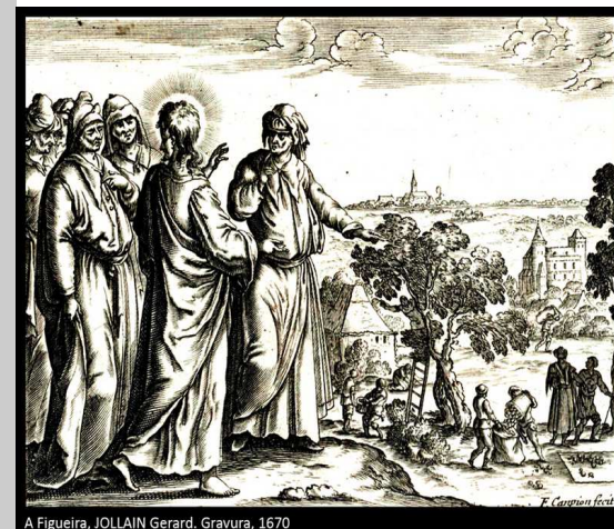
A Figueira, JOLLAIN Gerard. Gravura, 1670

Nesta terceira etapa da caminhada para a Páscoa somos chamados, mais uma vez, a repensar a nossa existência. O tema fundamental da liturgia de hoje é a “conversão”. Com este tema enlaça-se o da “libertação”: o Deus libertador propõe-nos a transformação em homens novos, livres da escravidão do egoísmo e do pecado, para que em nós se manifeste a vida em plenitude, a vida de Deus.