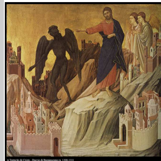
A Tentação de Cristo - Duccio di Buoninsegna ca. 1308-1311

No início da Quaresma, a Palavra de Deus apela a repensar as nossas opções de vida e a tomar consciência dessas “tentações” que nos impedem de renascer para a vida nova, para a vida de Deus.