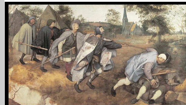
Parábola do cego a guiar outro cego. Pieter Bruegel (1568).

O tema central da liturgia deste domingo convida-nos a refletir sobre esta questão: aquilo que nos enche o coração e que nós testemunhamos é a verdade de Jesus, ou são os nossos interesses e os nossos critérios egoístas?