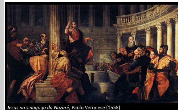
Jesus na sinagoga da Nazaré, Paolo Veronese (1558)