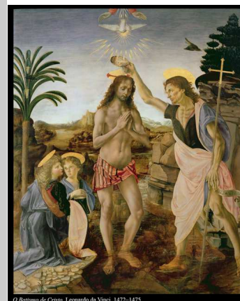
O Batismo de Cristo, Leonardo da Vinci, 1472-1475

A liturgia deste domingo tem como cenário de fundo o projeto salvador de Deus. No Batismo de Jesus nas margens do Jordão, revela-se o Filho amado de Deus, que veio ao mundo enviado pelo Pai, com a missão de salvar e libertar os homens. Cumprindo o projeto do Pai, Jesus fez-Se um de nós, partilhou a nossa fragilidade e humanidade, libertou-nos do egoísmo e do pecado, empenhou-Se em promover-nos para que pudéssemos chegar à vida plena.