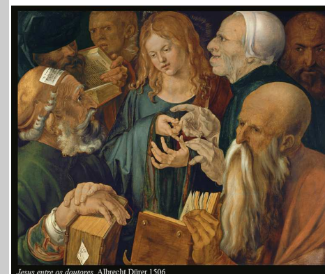
Jesus entre os doutores. Albrecht Dürer, 1506

A liturgia do 31º Domingo do Tempo Comum diz-nos que o amor está no centro da experiência cristã. O caminho da fé que, dia a dia, somos convidados a percorrer, resume-se no amor Deus e no amor aos irmãos – duas vertentes que não se excluem, antes se complementam mutuamente.