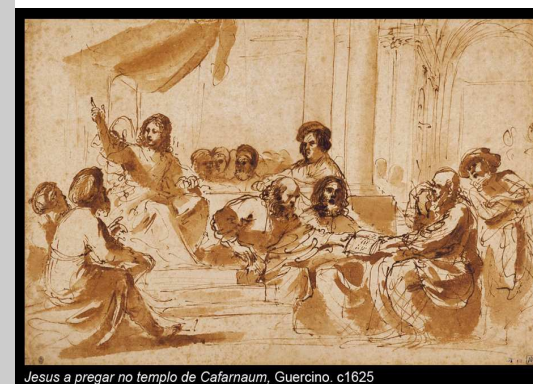
Jesus a pregar no templo de Cafarnaum, Guercino. c1625

A liturgia do 18º Domingo do Tempo Comum repete, no essencial, a mensagem das leituras do passado domingo. Assegura-nos que Deus está empenhado em oferecer ao seu Povo o alimento que dá a vida eterna e definitiva.