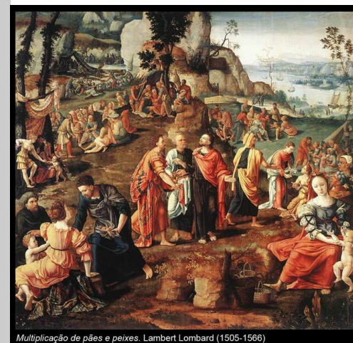
Multiplicação de pães e peixes. Lambert Lombard (1505-1566)

A liturgia do 17º domingo Comum dá-nos conta da preocupação de Deus em saciar a “fome” de vida dos homens. De forma especial, as leituras deste domingo dizem-nos que Deus conta connosco para repartir o seu “pão” com todos aqueles que têm “fome” de amor, de liberdade, de justiça, de paz, de esperança.