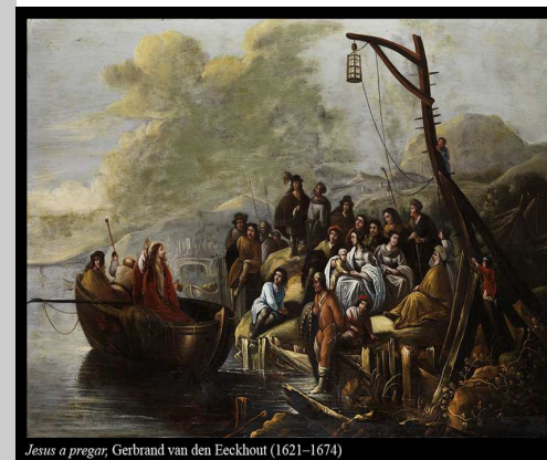
Jesus a pregar, Gerbrand van den Eeckhout (1621-1674)

A liturgia do 16º Domingo do Tempo Comum dá-nos conta do amor e da solicitude de Deus pelas “ovelhas sem pastor”. Esse amor e essa solicitude traduzem-se, naturalmente, na oferta de vida nova e plena que Deus faz a todos os homens.