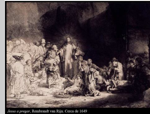
Jesus a pregar, Rembrandt van Rijn. Cerca de 1649

O tema deste 10.º Domingo do Tempo Comum gravita à volta da identidade de Jesus e da comunhão que Ele deseja estabelecer com aqueles que se colocam na disposição de o seguir: fica claro que Jesus não tem qualquer aliança com o Demónio e com o poder do mal e que se quer definir pela sua relação de obediência com Deus Pai, à qual convida todos aqueles que se querem sentir parte da sua família.