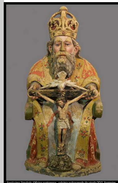
Santíssima Trindade. Oficina portuguesa, calcário policromado do século XVI. Santarém

A Solenidade que hoje celebramos não é um convite a decifrar o mistério que se esconde por detrás de “um Deus em três pessoas”; mas é um convite a contemplar o Deus que é amor, que é família, que é comunidade e que criou os homens para os fazer comungar nesse mistério de amor.