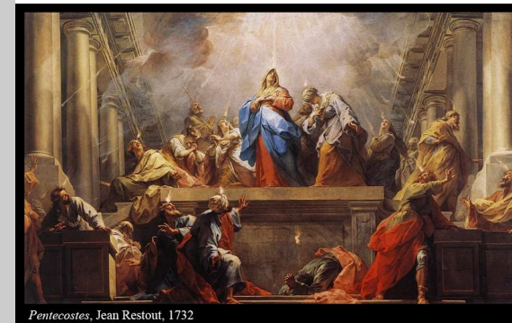
Pentecostes, Jean Restout, 1732

O tema deste domingo é, evidentemente, o Espírito Santo. Dom de Deus a todos os crentes, o Espírito dá vida, renova, transforma, constrói comunidade e faz nascer o Homem Novo.