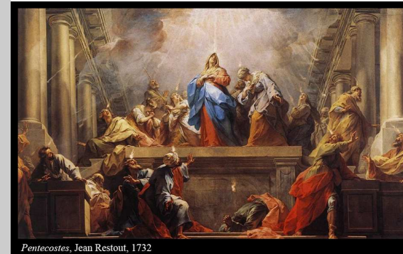
Pentecostes, Jean Restout, 1732

O tema deste domingo é, evidentemente, o Espírito Santo. Dom de Deus a todos os crentes, o Espírito dá vida, renova, transforma, constrói comunidade e faz nascer o Homem Novo.