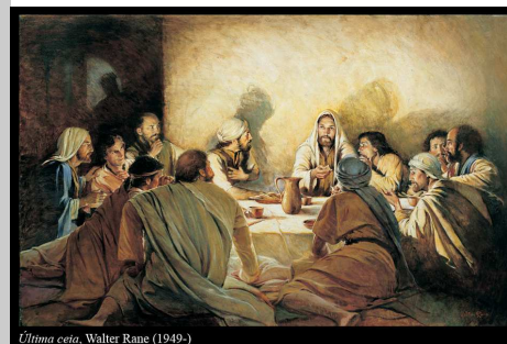
Última Ceia, Walter Rane (1949-)

A liturgia do 6º Domingo da Páscoa convida-nos a contemplar o amor de Deus, manifestado na pessoa, nos gestos e nas palavras de Jesus e dia a dia tornado presente na vida dos homens por ação dos discípulos de Jesus.