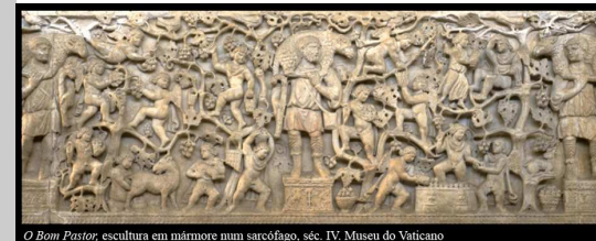
O Bom Pastor, escultura em mármore num sarcófago, séc. IV, Museu do Vaticano

O 4º Domingo da Páscoa é considerado o "Domingo do Bom Pastor", pois todos os anos a liturgia propõe, neste domingo, um trecho do capítulo 10 do Evangelho segundo João, no qual Jesus é apresentado como "Bom Pastor". É, portanto, este o tema central que a Palavra de Deus põe, hoje, à nossa reflexão.