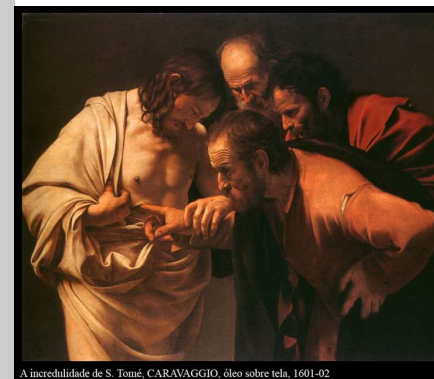
A incredulidade de S. Tomé, CARAVAGGIO, óleo sobre tela, 1601-02

A liturgia deste domingo apresenta-nos essa comunidade de Homens Novos que nasce da cruz e da ressurreição de Jesus: a Igreja. A sua missão consiste em revelar aos homens a vida nova que brota da ressurreição.