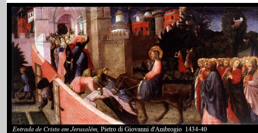
Entrada de Cristo em Jerusalém, Pietro di Giovanni d'Ambrogio 1434-40

A liturgia deste último Domingo da Quaresma convida-nos a contemplar esse Deus que, por amor, desceu ao nosso encontro, partilhou a nossa humanidade, fez-Se servo dos homens, deixou-Se matar para que o egoísmo e o pecado fossem vencidos. A cruz (que a liturgia deste domingo coloca no horizonte próximo de Jesus) apresenta-nos a lição suprema, o último passo