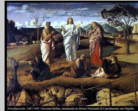
Transfiguração, 1487-1493. Giovanni Bellini, atualmente no Museo Nazionale di Capodimonte, em Nápoles.

No segundo Domingo da Quaresma, a Palavra de Deus define o caminho que o verdadeiro discípulo deve seguir para chegar à vida nova: é o caminho da escuta atenta de Deus e dos seus projetos, o caminho da obediência total e radical aos planos do Pai.