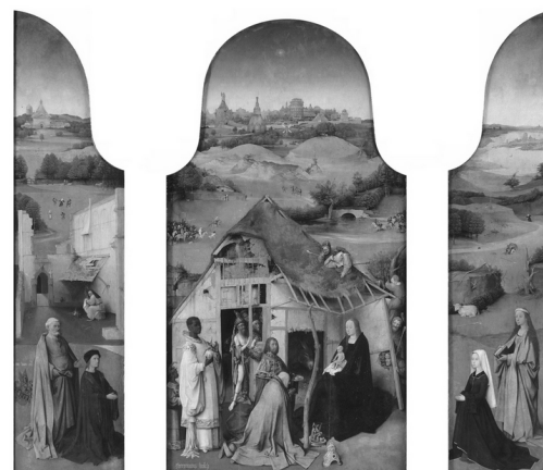
Adoração dos Magos, triptico - J. Bosch, 1495

A liturgia deste domingo celebra a manifestação de Jesus a todos os homens... Ele é uma "luz" que se acende na noite do mundo e atrai a si todos os povos da terra. Cumprindo o projeto libertador que o Pai nos queria oferecer, essa "luz" incarnou na nossa história, iluminou os caminhos dos homens, conduziu-os ao encontro da salvação, da vida definitiva.