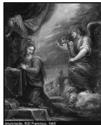
Anunciação, RIZI Francisco, 1665

A liturgia deste último Domingo do Advento refere-se repetidamente ao projeto de vida plena e de salvação definitiva que Deus tem para oferecer aos homens. Esse projeto, anunciado já no Antigo Testamento, torna-se uma realidade concreta, tangível e plena com a Encarnação de Jesus. A primeira leitura apresenta a “promessa” de Deus a David. Deus anuncia, pela boca do profeta Natã, que nunca abandonará o seu Povo nem desistirá de o conduzir ao encontro da felicidade e da realização plenas. A “promessa” de Deus irá concretizar-se num “filho” de David, através do qual Deus oferecerá ao seu Povo a estabilidade, a segurança, a paz, a abundância, a fecundidade, a felicidade sem fim.