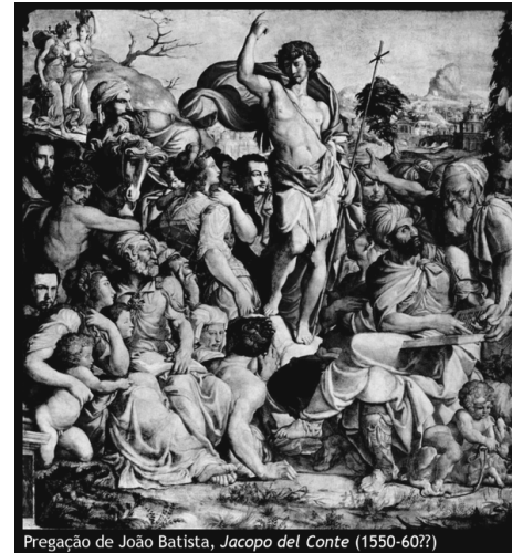
Pregação de João Batista, Jacopo del Conte (1550-60??)

As leituras do 3º Domingo do Advento garantem-nos que Deus tem um projeto de salvação e de vida plena para propor aos homens e para os fazer passar das “trevas” à “luz”.