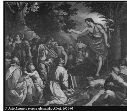
S. João Batista a pregar, Alessandro Allori, 1601-03

A liturgia do segundo domingo de Advento constitui um veemente apelo ao reencontro do homem com Deus, à conversão. Por sua parte, Deus está sempre disposto a oferecer ao homem um mundo novo de liberdade, de justiça e de paz; mas esse mundo só se tornará uma realidade quando o homem aceitar reformar o seu coração, abrindo-o aos valores de Deus.