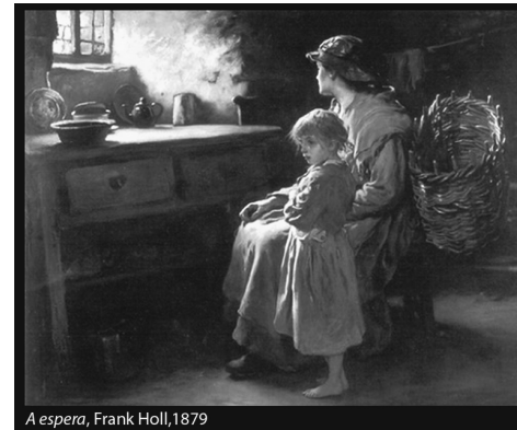
A espera, Frank Holl, 1879

A liturgia do primeiro Domingo do Advento convida-nos a equacionar a nossa caminhada pela história à luz da certeza de que “o Senhor vem”. Apresenta também aos crentes indicações concretas acerca da forma devem viver esse tempo de espera.