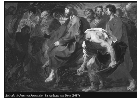
Entrada de Jesus em Jerusalém, Sir Anthony van Dyck (1617)

A liturgia do 31º Domingo do Tempo Comum convida-nos a uma reflexão séria sobre a seriedade, a verdade e a coerência do nosso compromisso com Deus e com o Reino. De forma especial, as leituras deste domingo interpelam os animadores das comunidades cristãs acerca da verdade do seu testemunho, da pureza dos seus motivos, do seu real empenho na construção de comunidades comprometidas com os valores do Evangelho.